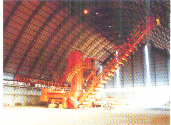
RASPADOR GIRATÓRIO SOBRE TRILHOS SLEWING SCRAPER ON RAILS