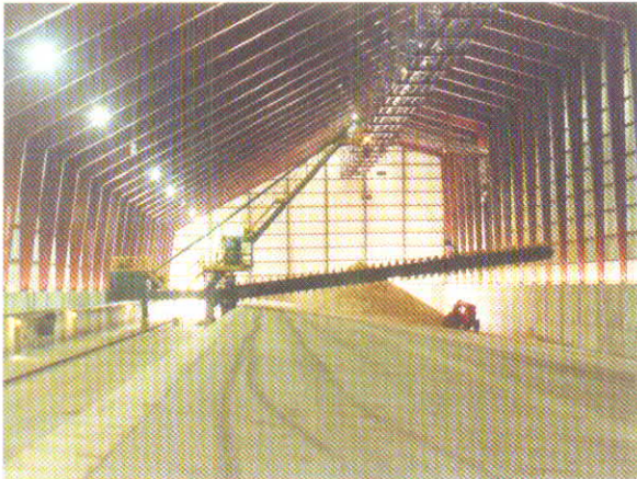
RASPADOR LATERAL - LATERAL SCRAPER